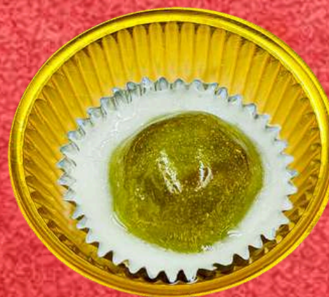
ใส่ใส้ใบเตย