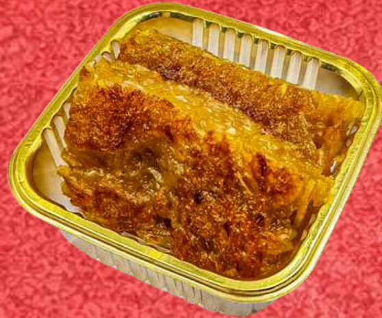
ข้าวขึ้นฟักทอง