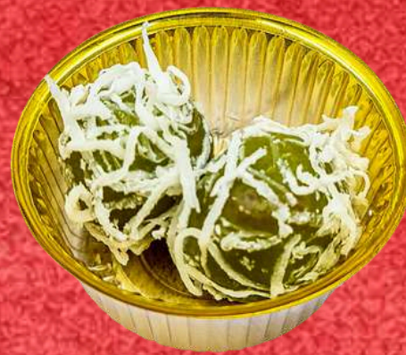
ขนมต้มใบเตย