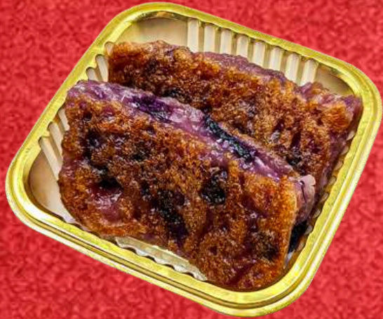
ข้าวขึ้นมันม่วง