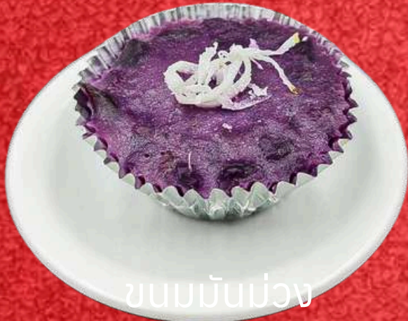
ขนมมันม่วง