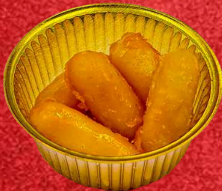
เม็ดขนุน