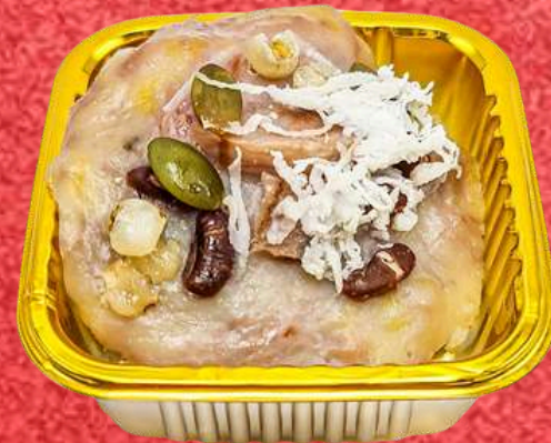
ขนมกล้วยธัญพืช