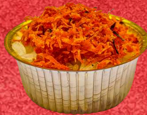
ข้าวเหนียวกุ้งแห้ง