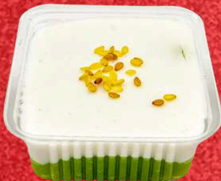
ตะโก้เปียกปูน