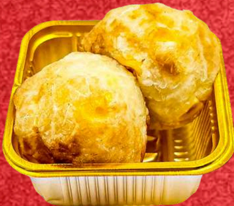
มันทิพย์