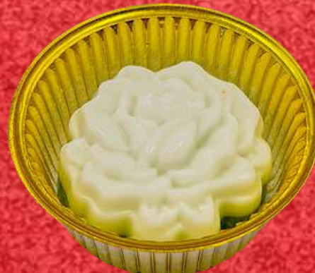
วุ้นกะทิใบเตย