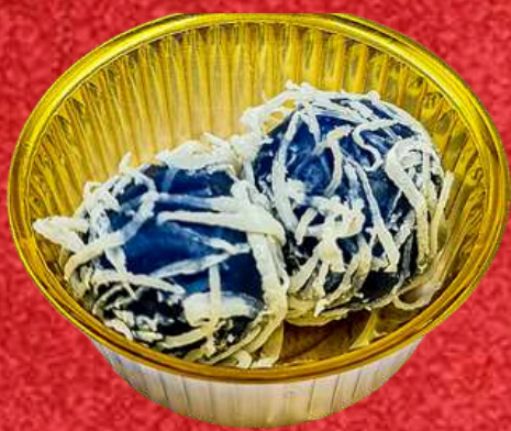
ขนมต้มอัญชัญ