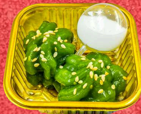
เปียกปูนกะทิสด