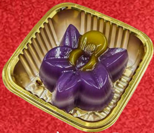
ขนมชั้นกล้วยไม้