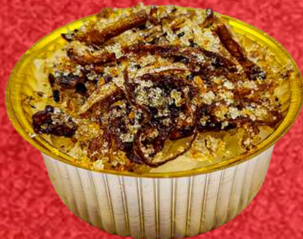
ข้าวเหนียวปลาแห้ง