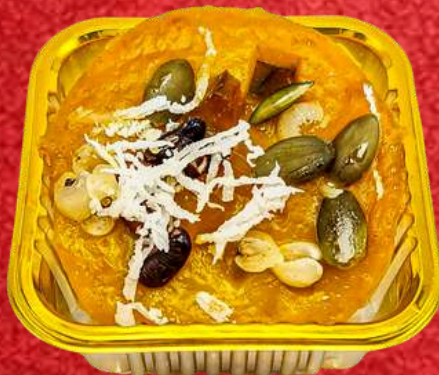
ขนมฟักทองธัญพืช