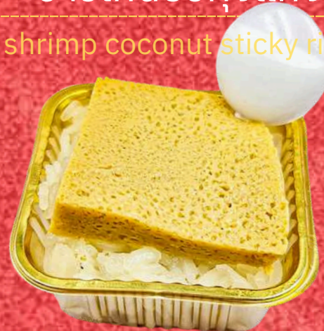
ข้าวเหนียวสังขยากะทิ