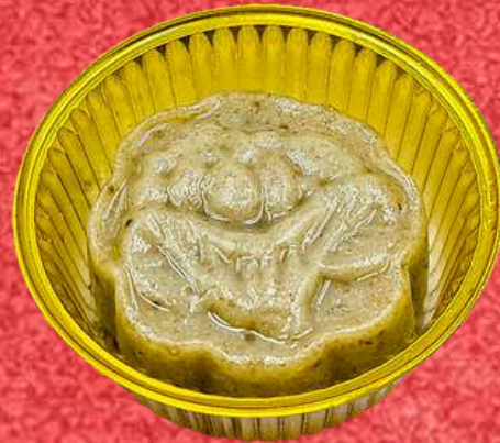
ขนมกล้วย