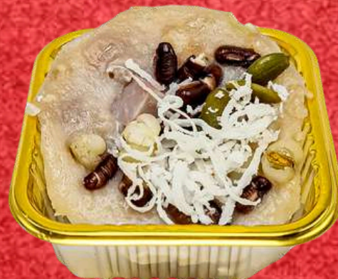
ขนมเผือกธัญพืช