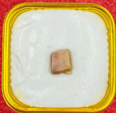
ตะโก้เผือก