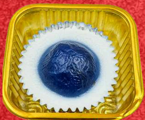
ใส่ใส่อัญชัญ