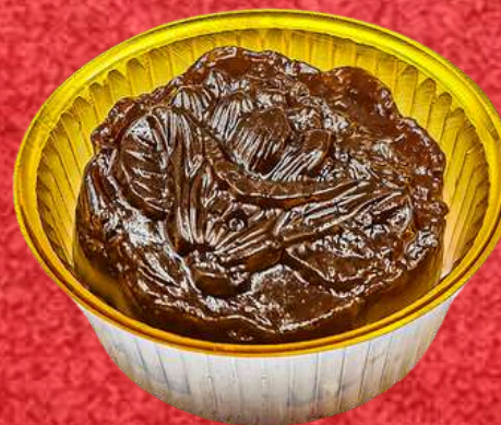
ขนมชั้นกาแฟ