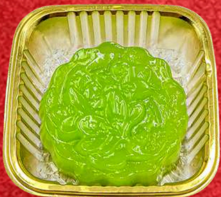
ขนมชั้นใบเตย