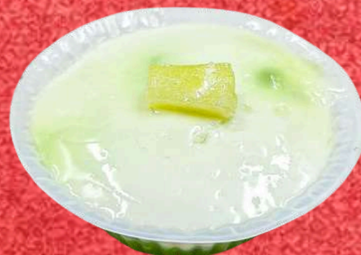
ตะโก้สาकुใบเตย