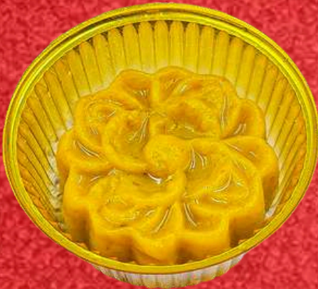
ขนมฟักทอง