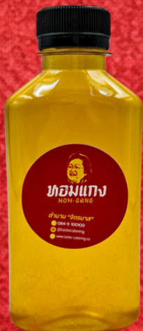
น้ำลำไย 180 ML. LONGAN DRINK