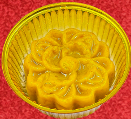
ขนมฟักทอง