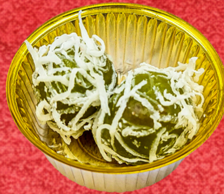
ขนมต้มใบเตย