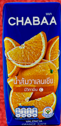
น้ำส้มวาเลนเซีย 180 ML. ORANGE JUICE