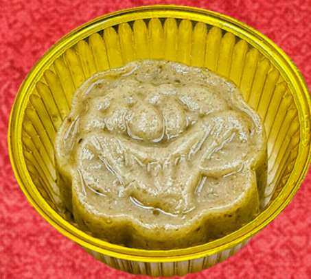
ขนมกล้วย