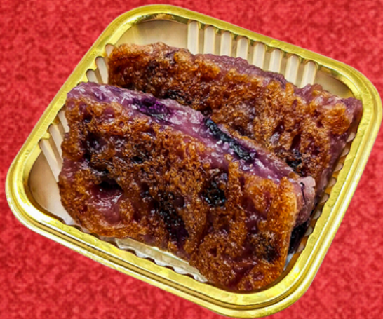
ข้าวปั้นมันม่วง