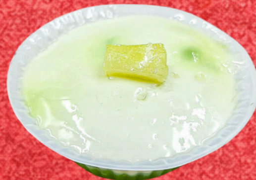
ตะโก้สาकुใบเตย