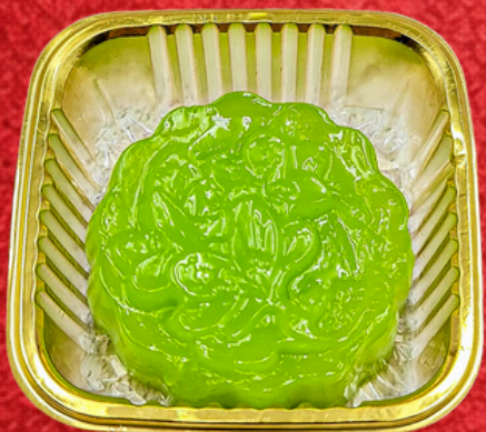
ขนมชั้นใบเตย