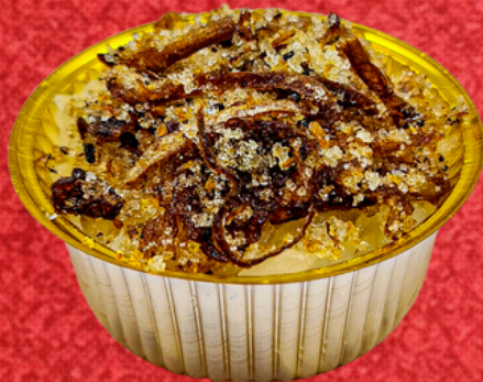
ข้าวเหนียวปลาแห้ง