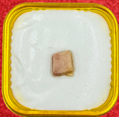
ตะโก้เผือก