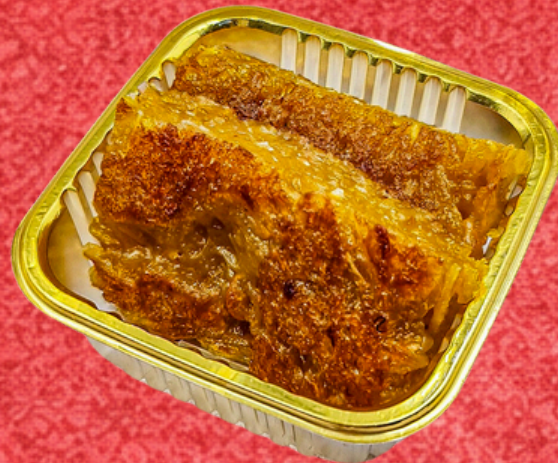
ข้าวปั้นฟักทอง