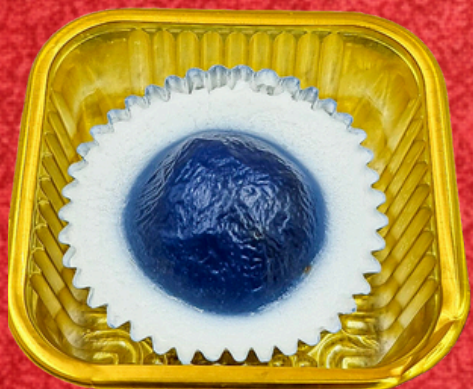
ใส่ใส่อัญชัญ