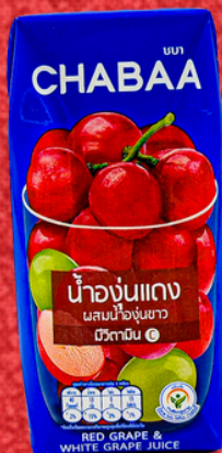
น้ำองุ่นแดง 180 ML. GRAPE JUICE