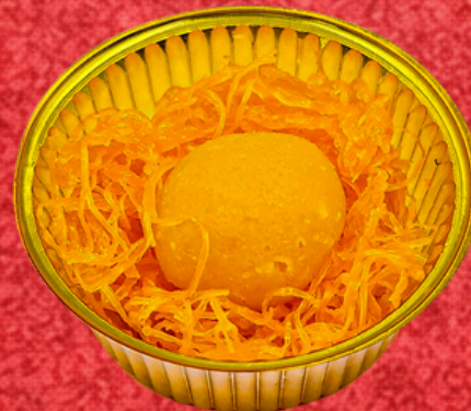
รังกนกทองหยอด