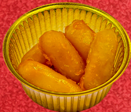
เมื่อดขนุน