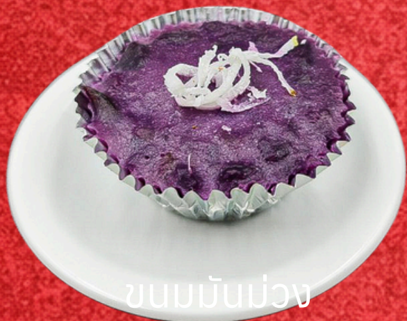
ขนมมันม่วง