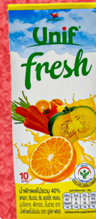
น้ำผักผลไม้รวม 180 ML. MIX FRUIT JUICE