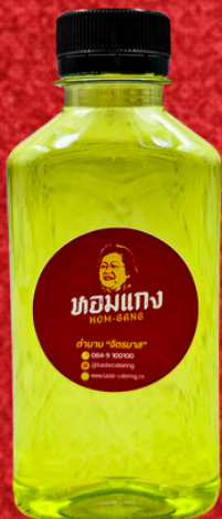
น้ำใบเตย 180 ML. PANDAN DRINK