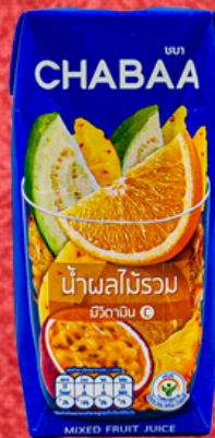
น้ำผลไม้รวม 180 ML. MIX FRUIT JUICE