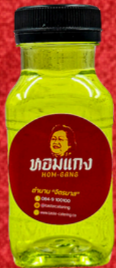
น้ำสมุนไพร 150 ML. HERBAL JUICE