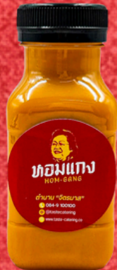
ชา/กาแฟ 150 ML. TEA/COFFEE