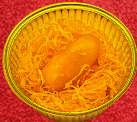
รังกนกเมื่อดขนุน