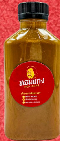
ชา/กาแฟ 180 ML. TEA/COFFEE