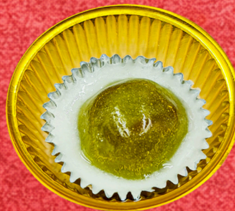
ใส่ใส้ใบเตย