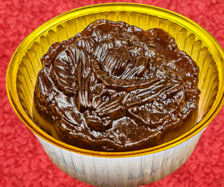
ขนมชั้นกาแฟ