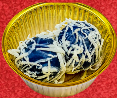
ขนมต้มอัญชัญ