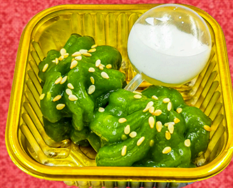
เป็ยกปูกะทิสด