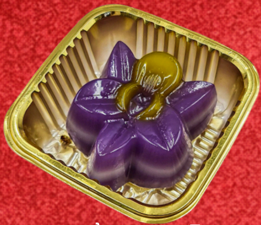
ขนมชั้นกล้วยไม้