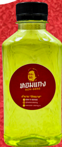
น้ำสมุนไพร 180 ML. HERBAL JUICE