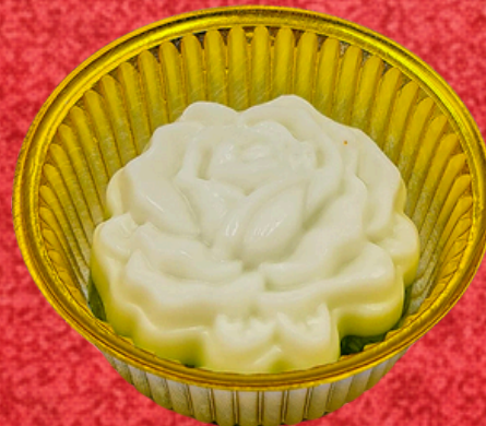
วุ้นกะทิใบเตย