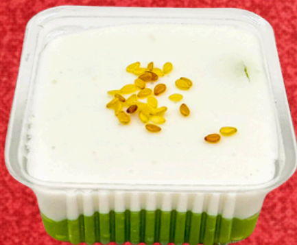
ตะโก้เปียกปูน