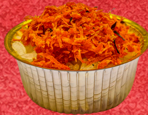
ข้าวเหนียวกุ้งแห้ง