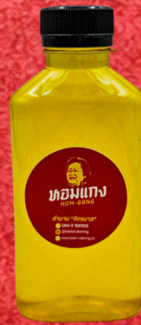
น้ำเก๊กฮวย 180 ML. CHRYSANTHEMUM DRINK