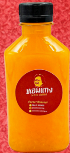
น้ำส้ม 180 ML. ORANGE JUICE