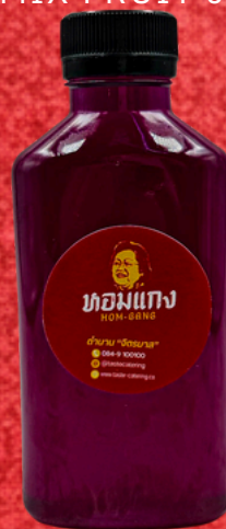
น้ำอัญชัญมะนาว 180 ML. BUTTERPEA LIME DRINK