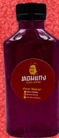
น้ำอัญชัญมะนาว 180 ML. BUTTERPEA LIME DRINK