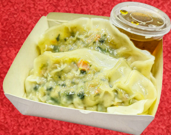
เกี้ยวไก่ลุยสวน