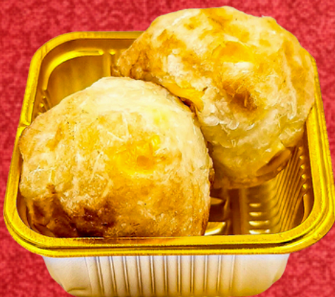
มันทิพย์