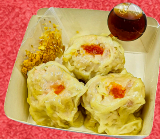
ขนมอบหมูไข่เค็ม