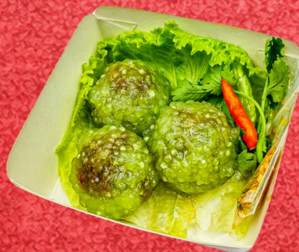
สาकुใบเตยไส้หมู