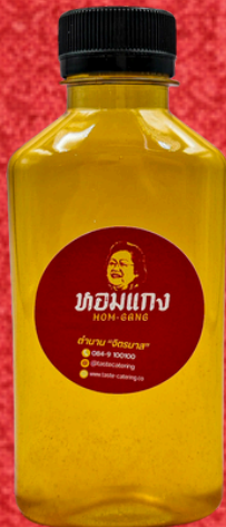
น้ำลำไย 180 ML. LONGAN DRINK