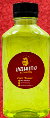
น้ำใบเตย 180 ML. PANDAN DRINK