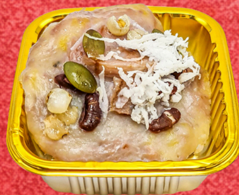
ขนมกล้วยธัญพืช