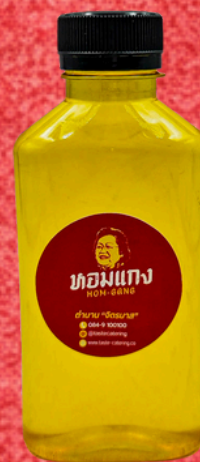
น้ำเก๊กฮวย 180 ML. CHRYSANTHEMUM DRINK