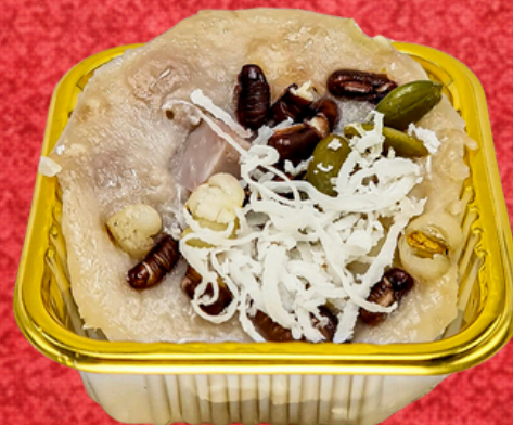
ขนมเผือกธัญพืช