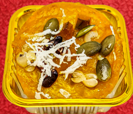
ขนมฟักทองธัญพืช