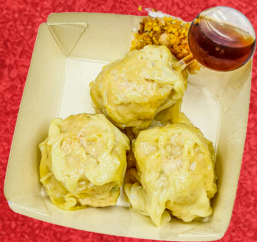
ขนมอบไก่