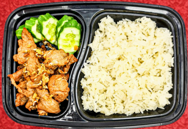
E019 ข้าวเหนียวหมุกทอดกระเทียม