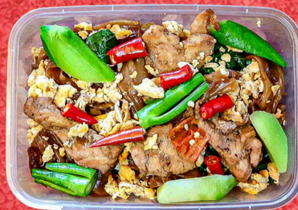
E020 ผัดซีอิ๊วรสเจ็บ