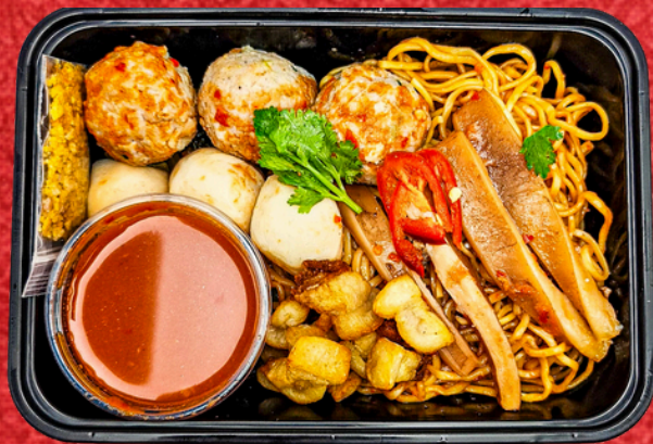
E016 บะหมี่เย็นตาโฟ