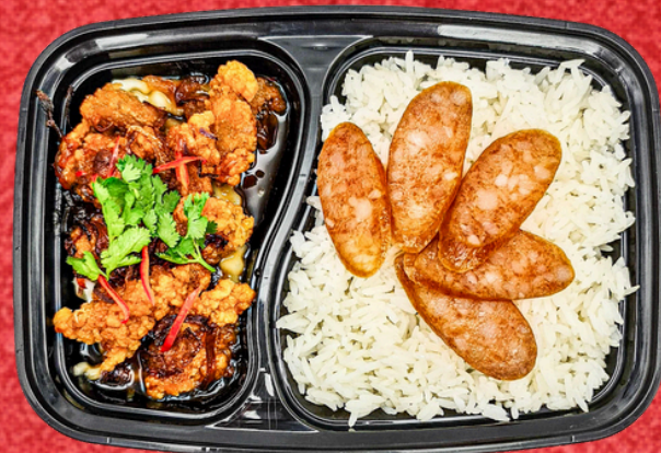
E021 ข้าวสวยไก่ทอดซอสมะขาม+ไก่เซียง

Chicken Soy Sauce Chicken Basil Cake Rice