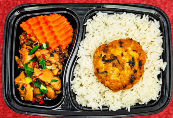
E024 ข้าวสวยไก่ผัดซีอิ้ว+หมูสับ กะเพราก้อน

Chicken Green Curry Fried Chicken Sesame Rice