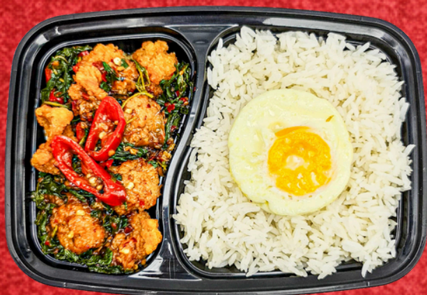
E020 ข้าวสวยไก่กระเทียมซอส กะเพรา+ไข่ดาว

Chicken Green Curry Fried Chicken Sesame Rice