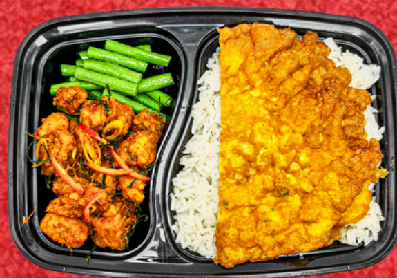
E025 ข้าวสวยคั่วกลิ้งปลา+ไข่เจียวต้นหอม

Fish Chili Paste Bean Mixed Fried Egg Rice