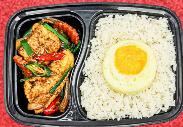
E023 ข้าวสวยปลาผัดพริกไทยดำ+ไข่ดาว