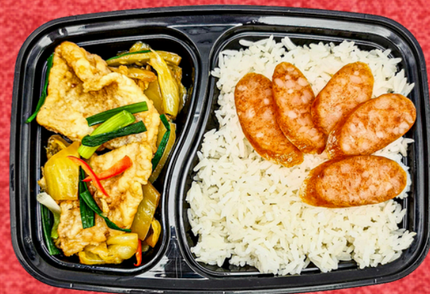
E022 ข้าวสวยปลาทอดผัดเค็มน้ำ +ไก่เซียง

Chicken Tamarind Sauce Chicken Sausage Rice