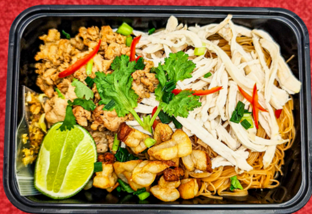
E026 เส้นหมี่คลุกไก่ฉีก