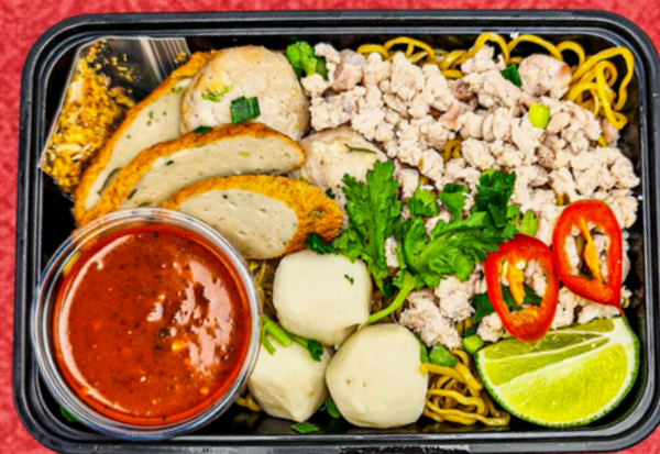
E019 บะหมี่ต้มยำแห้งหมู